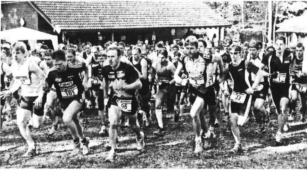
Crossduathlon im Ortelsbruch