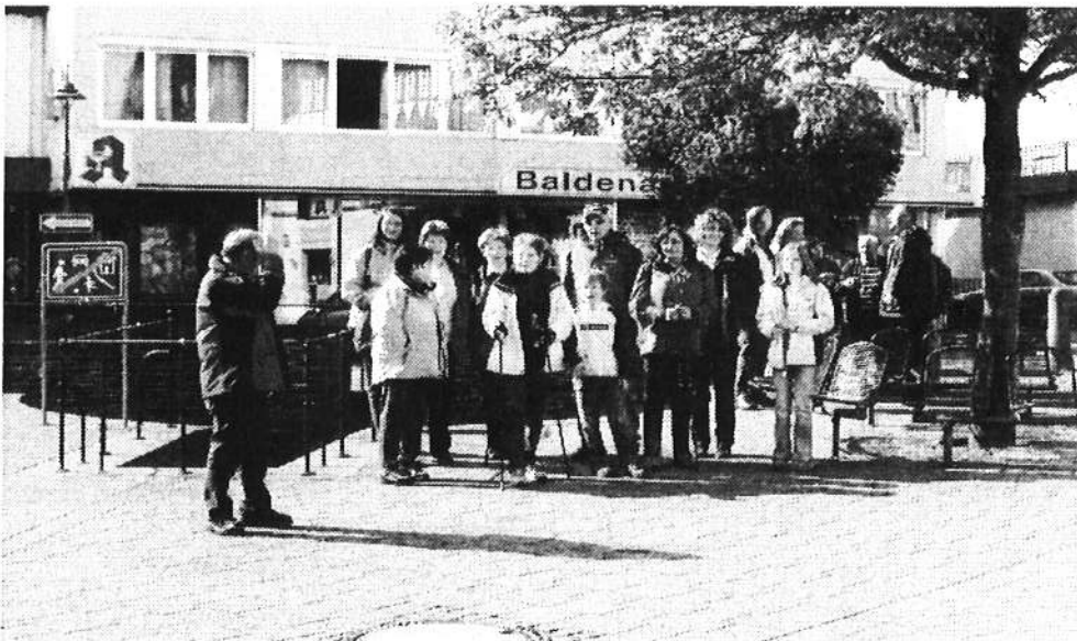
Götzwanderung Start am Unteren Markt